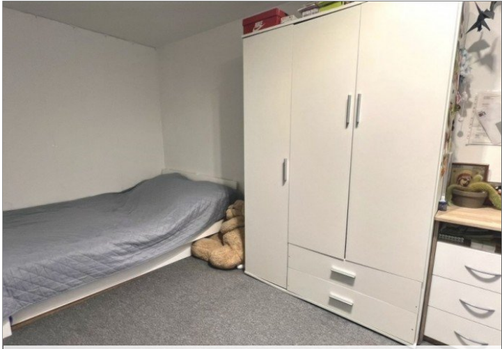
Arbeits - oder Kinderzimmer (2)