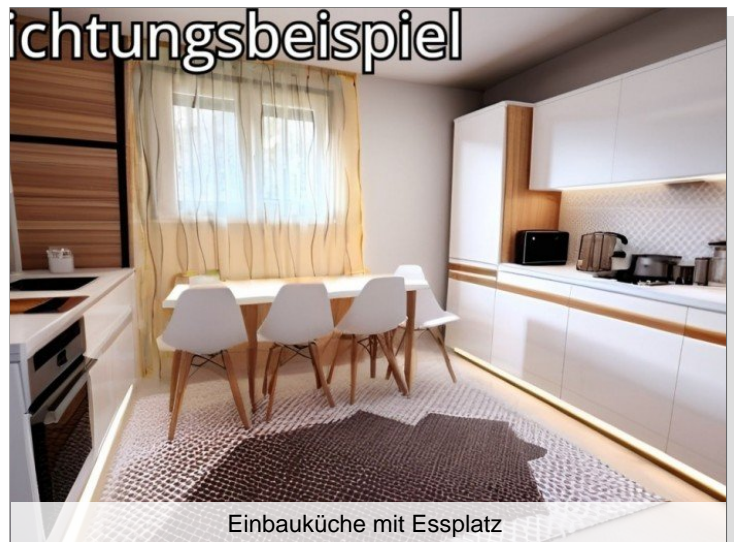
Einbauküche mit Essplatz