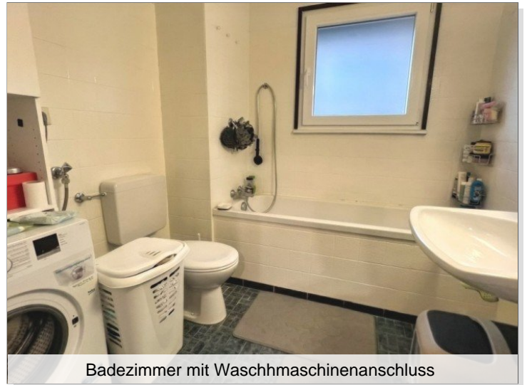
Badezimmer mit Waschmaschinenanschluss