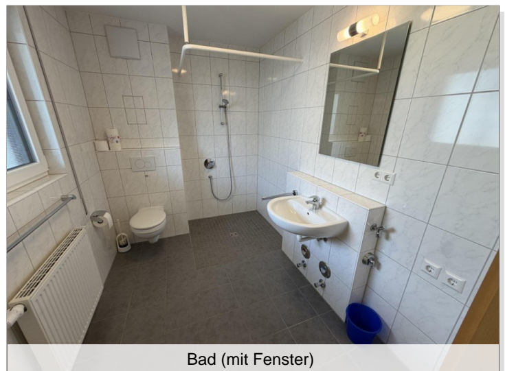
Bad (mit Fenster)