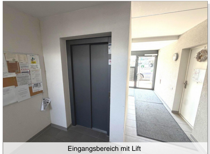
Eingangsbereich mit Lift