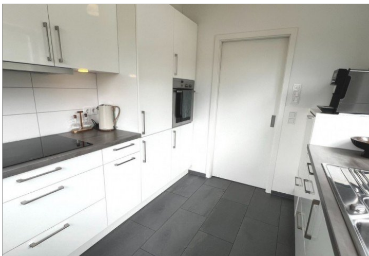
moderne Einbauküche mit Elektrogeräten (2)