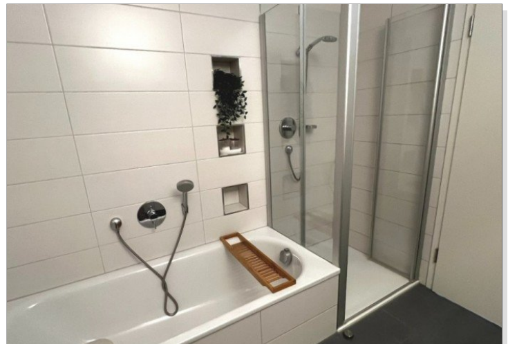
Badewanne und Dusche