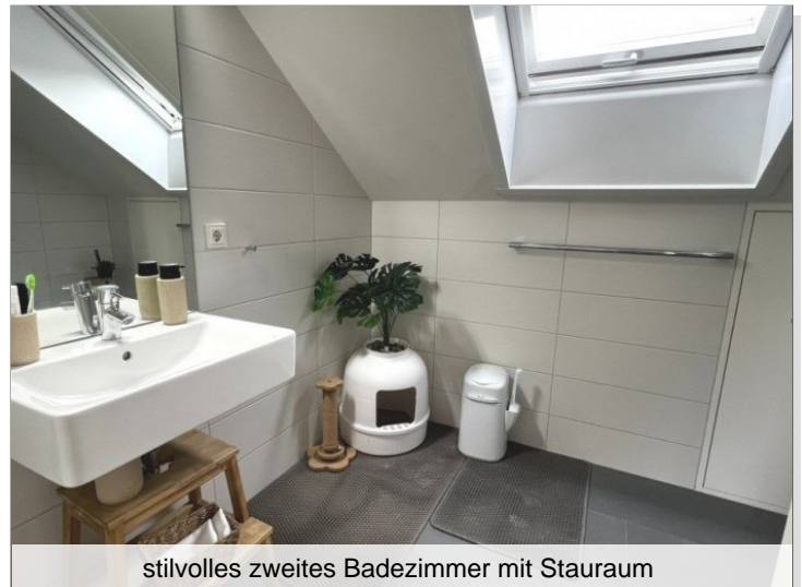
stilvolles zweites Badezimmer mit Stauraum