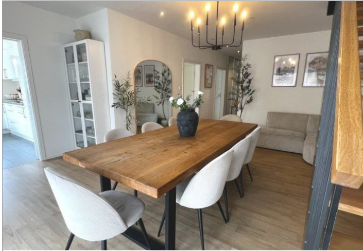
lichtdurchflutet Wohn - und Essbereich (2)