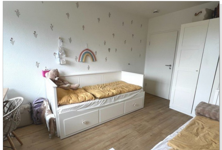
wohnliches Arbeits - oder Kinderzimmer (2)