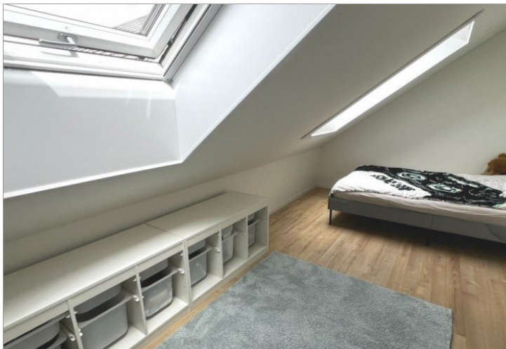
praktisches Arbeits -oder Kinderzimmer