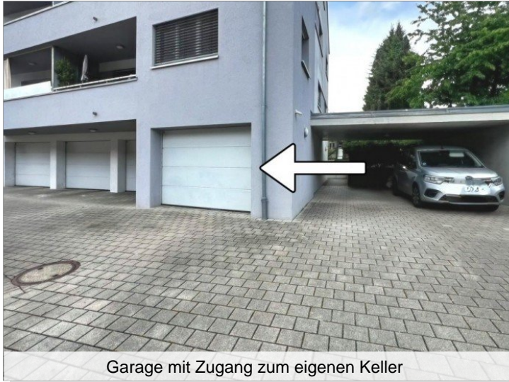
Garage mit Zugang zum eigenen Keller