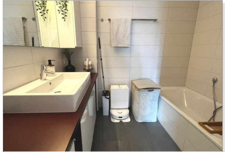
elegantes Badezimmer mit Dusche und Badewanne (1)