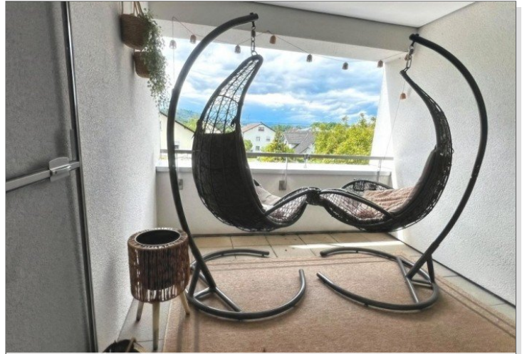
freundlicher kleiner Balkon