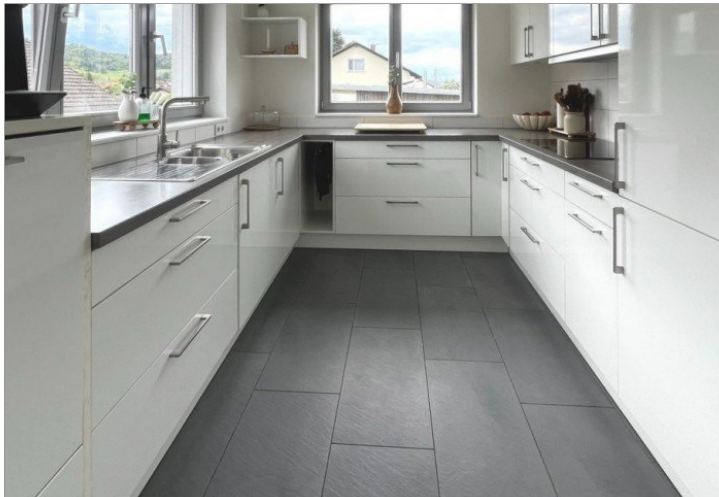
moderne Einbauküche mit Elektrogeräten