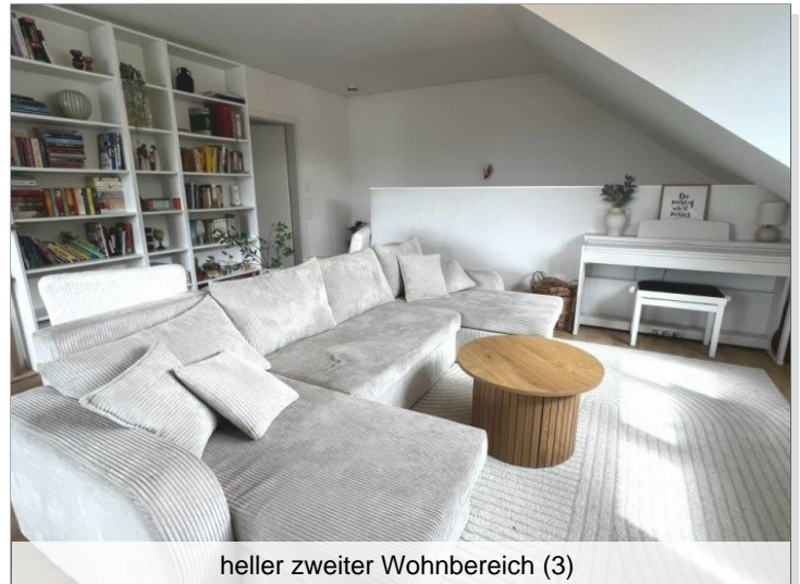
heller zweiter Wohnbereich (3)