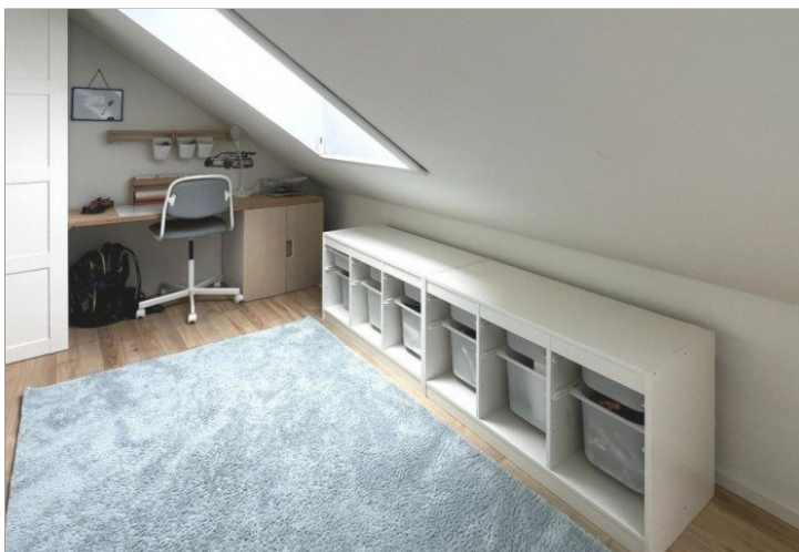
praktisches Arbeits -oder Kinderzimmer (2)