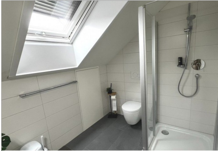
stilvolles zweites Badezimmer mit Dusche (2)