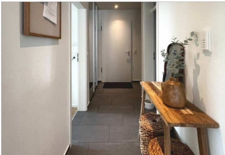
offener Flur (2)