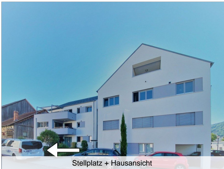
Stellplatz + Hausansicht