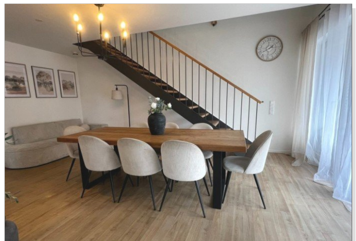
lichtdurchflutet Wohn- und Essbereich