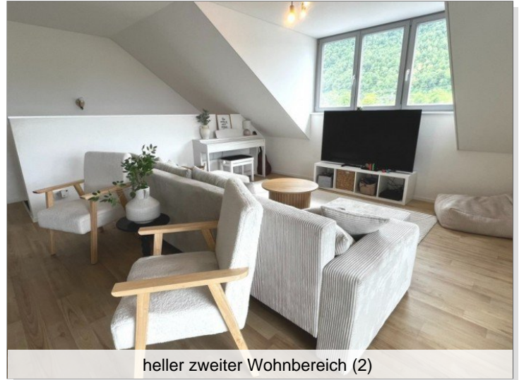
heller zweiter Wohnbereich (2)