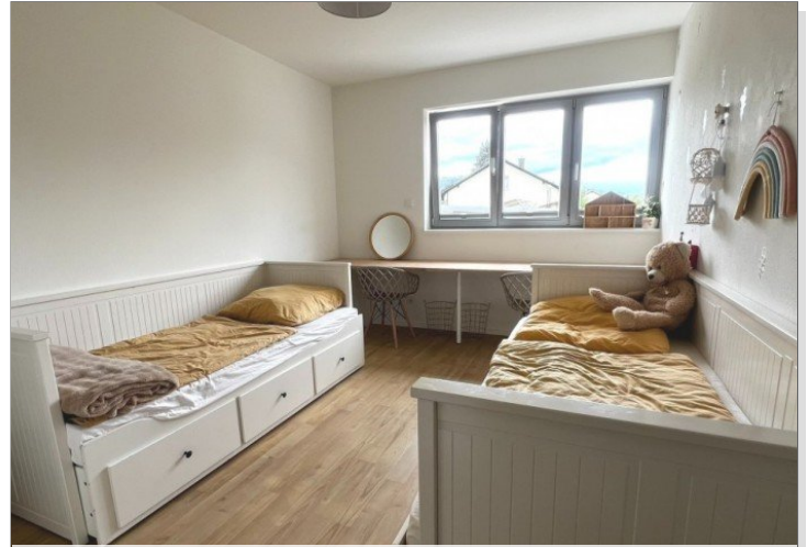
wohnliches Arbeits - oder Kinderzimmer